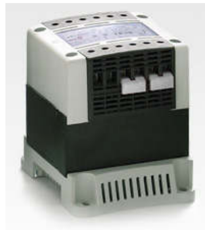
Transformateur BT finition IP20

Classe B Tamb maxi : 40°C Fréquence : 50/60Hz Rigidité diélectrique : >4kV entre PRI/SEC Refroidissement : naturel air