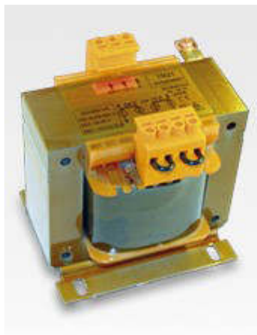
Transformateur BT finition IP00

L'assemblage est étudié de manière à réduire le poids et à réduire au maximum les vibrations du circuit magnétique.