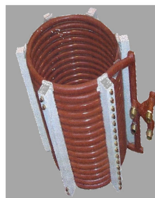
Remises en état